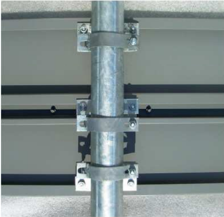
fot. 5 Tablica zamocowana do słupka za pomocą uchwytu typu „zacisk”

e-mail: biuro@sklepdrogowy.pl , www.sklepdrogowy.pl , tel. (22) 224 69 76, fax. (22) 379 64 86