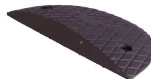
Zakończenie ZPW-40 czarne

Krajowa Ocena Techniczna Nr IBDiM-KOT-2017/0033 wydanie 3 Progi zwalniające podrzutowe z tworzyw sztucznych 21.07.2017r. - 21.07.2027r.