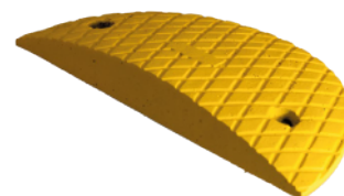
Zakończenie ZPW-40 żółte