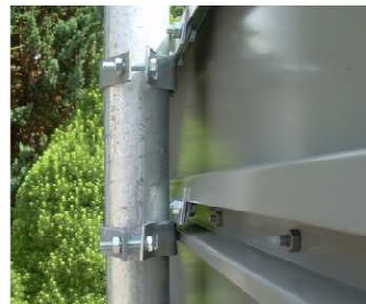
fot. 4 Uchwyt typu „zacisk” zamocowany do tablicy – widok od strony śruby