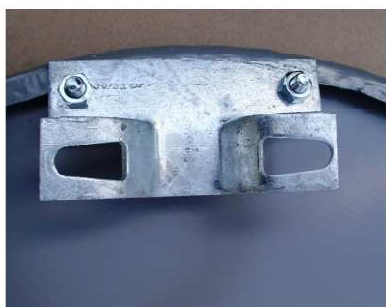
fot. 2 Uchwyt typu „zacisk” zamocowany do znaku

Prawidłowo zamocowany uchwyt przedstawiają fotografie 2, 3 i 4.