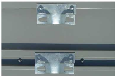
fot. 2 Uchwyt typu „zacisk” zamocowany do profilu

Prawidłowo zamocowany uchwyt przedstawiają fotografie 2, 3, 4 i 5.