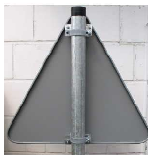
fot. 4 Uchwyt typu „zacisk” zamocowany do krawędzi znaku