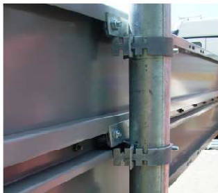
fot. 3 Uchwyt typu „zacisk” zamocowany do tablicy – widok od strony zębka