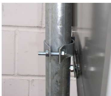
fot. 3 Uchwyt typu „zacisk” – widok od strony śruby